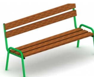
Fot.11 Przykładowe zdjęcie

Urządzenie na stałe posadowione w gruncie, betonowane betonem klasy min. B-15.